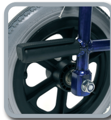
Ankipphilfe zum Neigen des Rollstuhls nach hinten