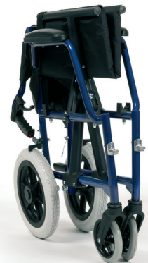
Rücken abklappbar für den Transport