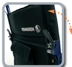
faltbare Rückenlehne mit integrierter Tasche

Ein perfekter Begleiter für den Urlaub, im Krankenhaus, bzw. für jeglichen Transport des Patienten. Extrem leicht, einfach zu falten, klein zum Verstauen.