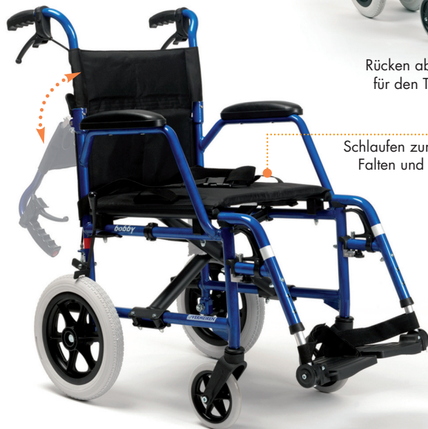
Schlaufen zum schnellen Falten und Tragen des Rollstuhls