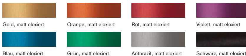
Gold, matt eloxiert